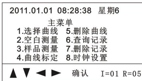
图二 液晶屏示意图